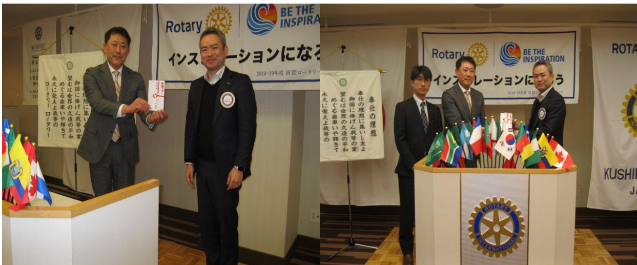
2月25日月曜日～3月1日金曜日、釧路新聞朝刊に寄付金贈呈の記事が掲載される予定です